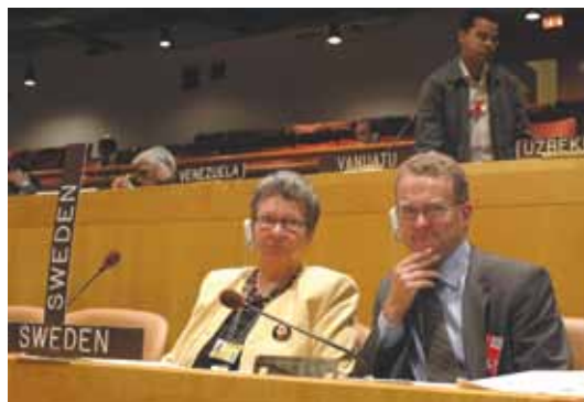
UNFF-sammanträde, New York.

Sverige har deltagit aktivt i de tidigare förhandlingsrundorna IPF och IFF, bland annat för att få gehör för den svenska skogsbruksmodellen. Inför IPF:s fjärde möte arrangerade till exempel Sida ett möte i samarbete med Uganda där den svenska konsensusmodellen för nationell skogsplanering lanserades. Sveriges afrikanska skogssamarbete vidareutvecklades under UNFF och resulterade år 2004 i ytterligare två möten om hållbart skogsbruk i Afrika initierade av Kungl. Skogs- och Lantbruksakademien (KSLA), FAO och det afrikanska skogsforskningsnätverket ( African Forest Research Network , AFORNET). Sverige har ansett det vara vik-